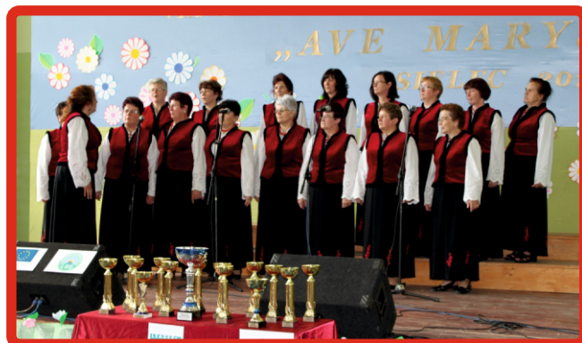
Zespół „Sidzinianki z Sidziny