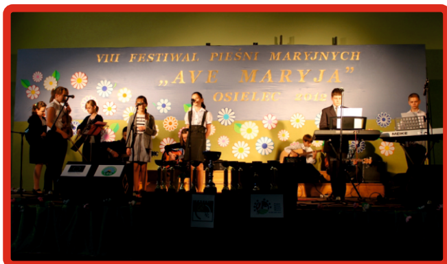
Zespół „By Arts” z Bystrej

W pierwszych dniach maja w Osielcu odbył się VIII Festiwal Pieśni Maryjnych „Ave Maryja”. W tegorocznej edycji uczestniczyło 37 podmiotów śpiewających i jak co roku, nie zabrakło w nim uczestników z terenu naszej gminy. W trakcie dwóch dni trwania festiwalu publiczność mogła wysłuchać wielu pieśni religijnych w wykonaniu chórów, scholi, solistów i duetów a także zespołów, w tym zespołu Gospodyń Sidzinianki z Sidziny a także zespołów dziecięcych z Bystrej: „Iskierki” z Przedszkola z Bystrej oraz zespołu „By Arts” i chóru „Ego Et Tu” działających przy Zespole Szkół w Bystrej. Grupy z terenu naszej gminy wywalczyły swoimi występami wysokie miejsca- w kategorii: „zespół- grupa dziecięca” drugie miejsce zajął zespół „By Arts” z Bystrej a trzecie miejsce zajęły Iskierki z Przedszkola w Bystrej. W kategorii: „zespół ludowy” drugie miejsce wyśpiewały panie z Zespołu Sidzinianki z Sidziny. Gratulujemy. (BL)