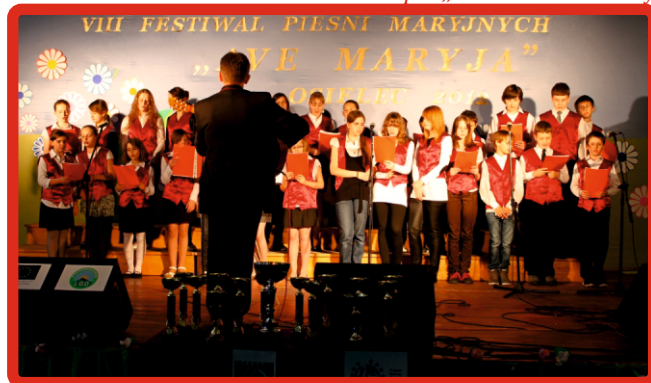
Chór „Ego Et Tu” z Bystrej