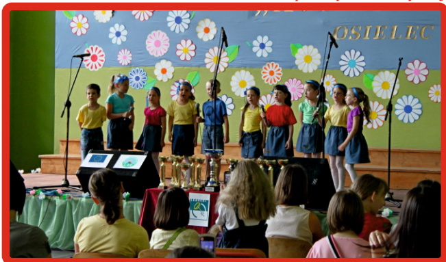
Zespół „Iskierki” z Przedszkola Publicznego w Bystrej